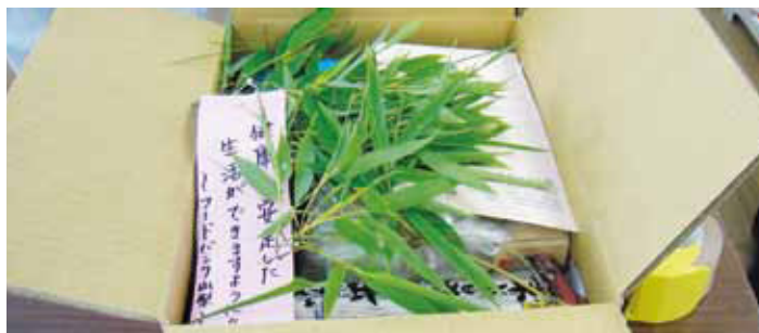
七夕にあわせて笹と短冊を同封しました